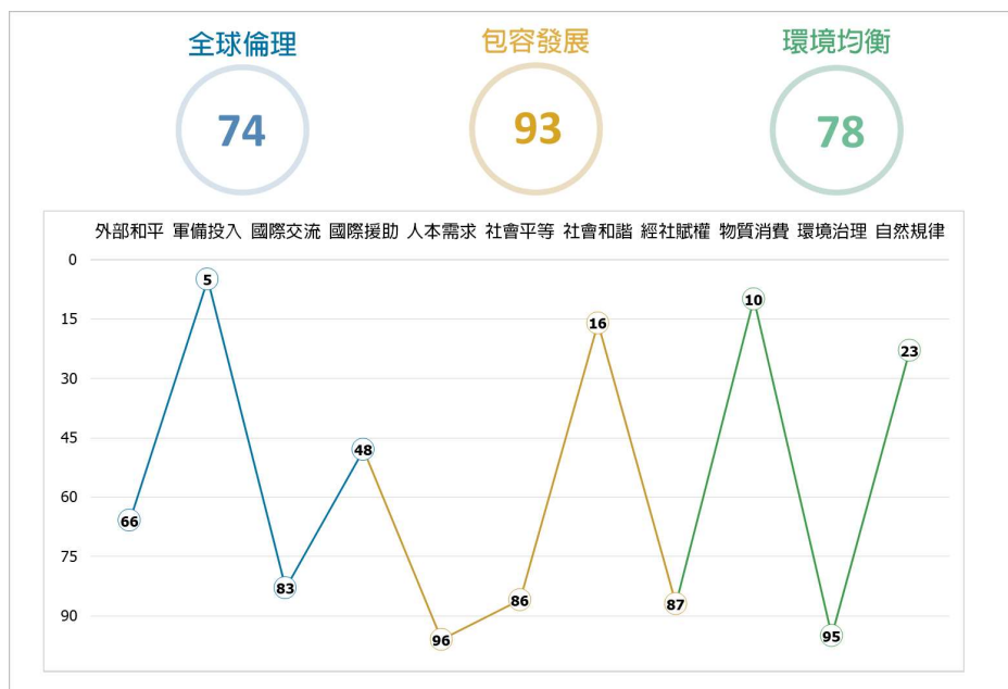
WDSI 3 領域及 11 面向排名示意圖