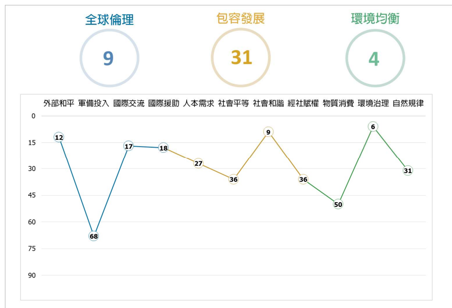
WDSI 3 領域及 11 面向排名示意圖